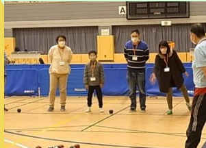
大人対子どもで対決です