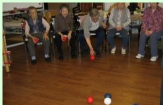
円陣でもできます