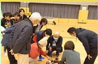
みんなでボールを真剣に確認中