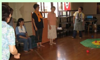
的に向かって投げてみます