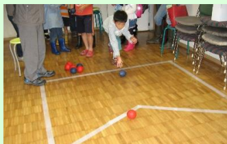
コート小さくしてもできます