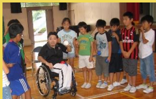
小学校の授業でも紹介しています