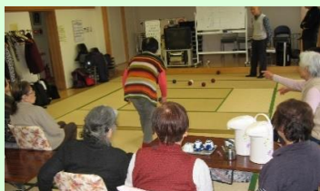
たたみの上でもやっています