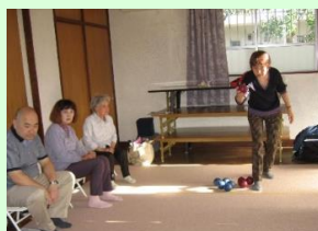
じゅうたんの上でも大丈夫