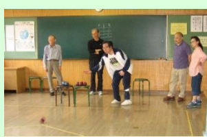
教室でもできました