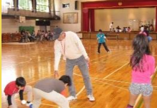
学校体育館で親子大会を開催