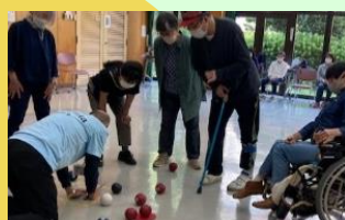
誰とでも一緒にできます