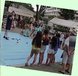
野外のお祭りでも活躍