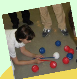
ボールの位置を計測中