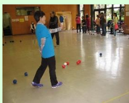
審判にも挑戦します