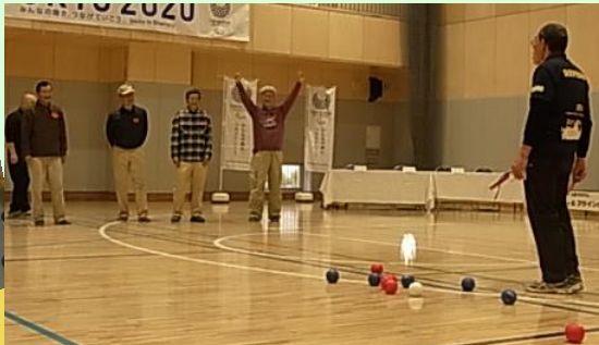
広い場所ではダイナミックにできます